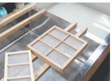
伝統工芸の紙すき体験

磐田市にあるこの体験型文化施設 は、ガラスや金属造形の充実した工 房を備え、専属アーティストらが独 自のアート作品を制作しています。 また、ギャラリーでは、年間12回の 企画展を開催。子どもから高齢者ま で、気軽にアートの世界を楽しんで もらえるよう、造形教室や工房見学、 アクセサリー作り等ができる造形体 験コーナーを 実施していま す。ほかに、 オリジナルア ート作品の販 売ショップや レストランな どもありま す。