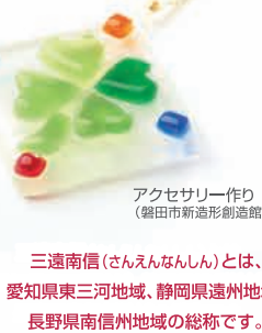
アクセサリー作り (磐田市新造形創造館)

三遠南信(さんえんなんしん)とは、 愛知県東三河地域、静岡県遠州地域、 長野県南信州地域の総称です。