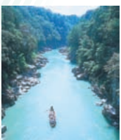
天龍峡の景観と川下り

夏休みの時期には、子どもから参加 できる工房講師による特別講座を開 催。3歳から参加可能なスノーードー ム保護者が同伴、小学生以上が参 加のステンドグラスやアルミのロボ ット作りなどを実施します。