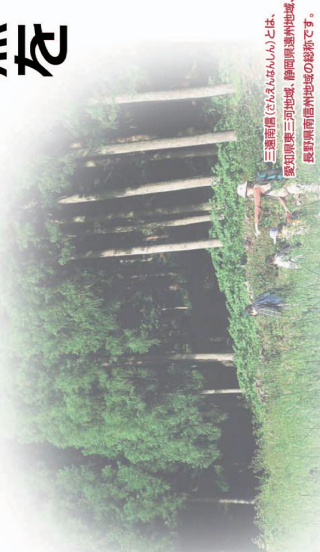
三遠南信(三遠南信)とは、愛知県東三河地域、静岡県遠州地域、長野県南信州地域の総称です。