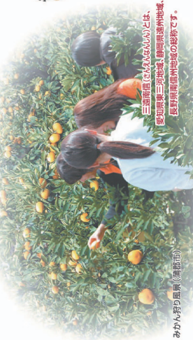
三遠南信(せんだんなんしん)とは、静岡県東三河地域、静岡県遠州地域、長野県南信州地域の総称です。