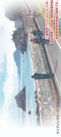
サイクリングロード (田原市)