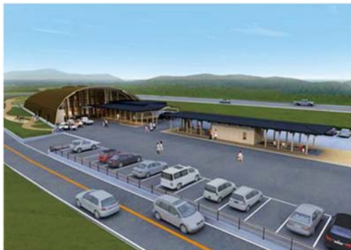
道の駅「もっくる新城」(完成予想図)