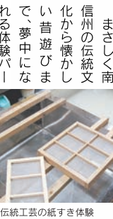
伝統工芸の紙すき体験

伊那谷道中は、江戸から明治にかけての伊那谷の街並みが再現しており、古き時代の「ものづくり」を体験できるミュージアムパークです。エリア内には、伝統工芸館や体験工房など、30以上の施設が集まっており、いろいろな体験や無料の昔遊びもできます。また、伊那谷温泉やレストランなどの食事処も揃っているため、体験にチャレンジした後は温泉や食事を楽しめます。